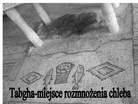
Tabgha-miejsce rozmnożenia chleba

Dzieci w czasach Chrystusa, a może i dzisiaj nie są chyba przez dorosłych traktowane zbyt poważnie. A to właśnie od dziecka Jezus przyjął żywność i nasycił nią ludzi. Właśnie to było potrzebne by ukazać jak wielkie rzeczy przygotował Bóg dla dzieci.